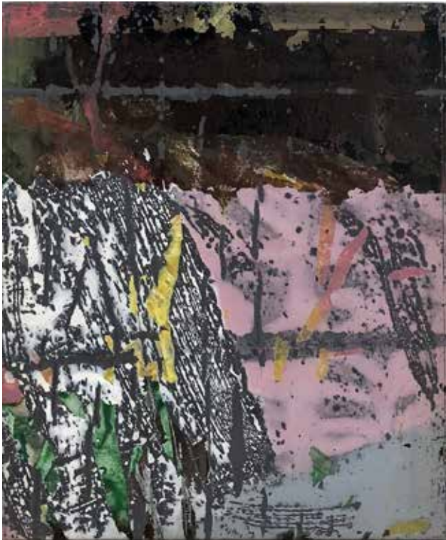
Sans titre , 1989 Techniques mixtes sur toile, 46 cm x 38 cm