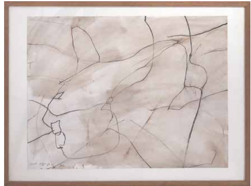
Daniel DEZEUZE "La vie amoureuse des plantes", 1992 Lavis et pastel sur papier, 49 cm x 64 cm