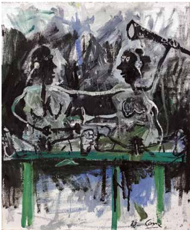
Louis CANE, Sans titre , 1988 Huile sur toile 65 cm x 54 cm