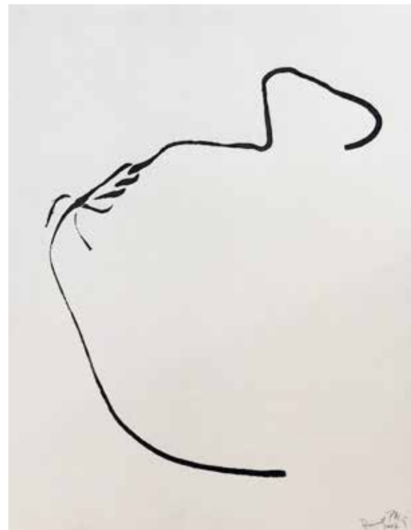
Bernard PAGÈS Sans titre , 1997 Embossage et graphite sur papier, 70 cm x 50 cm