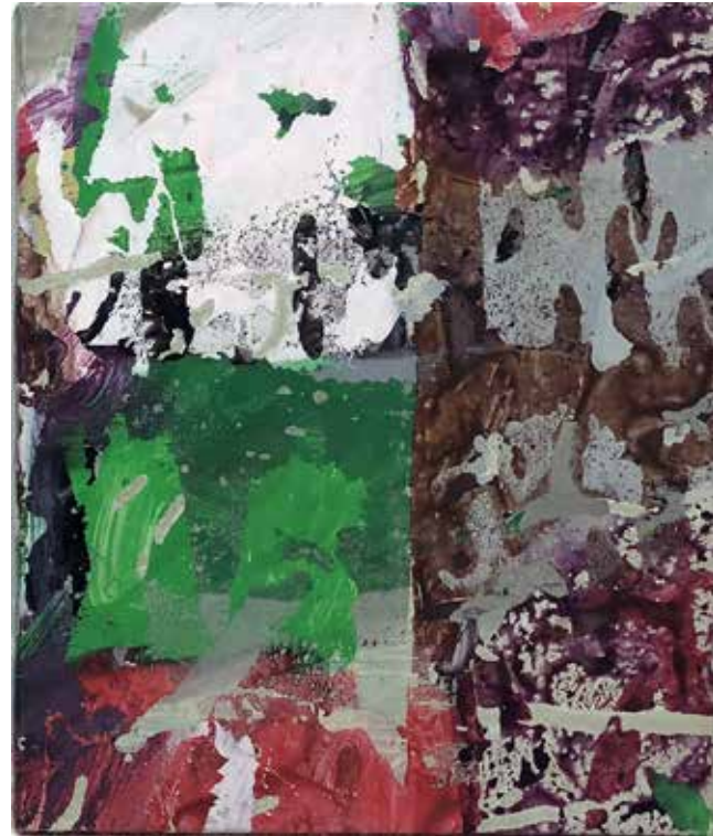
Sans titre , 1989 Techniques mixtes sur toile, 41 cm x 36 cm