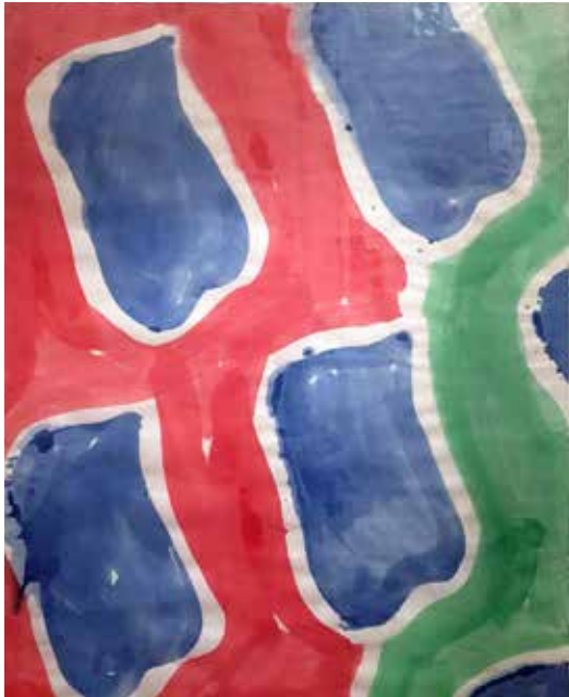
Claude VIALLAT Sans titre (détail), 2003 Acrylique sur papier